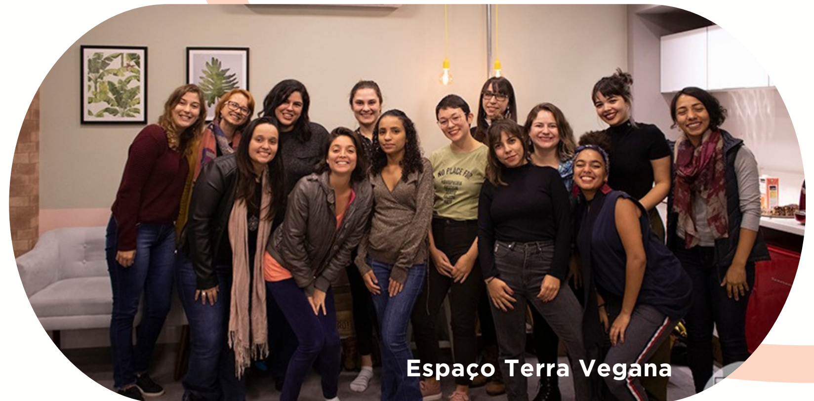
Espaço Terra Vegana