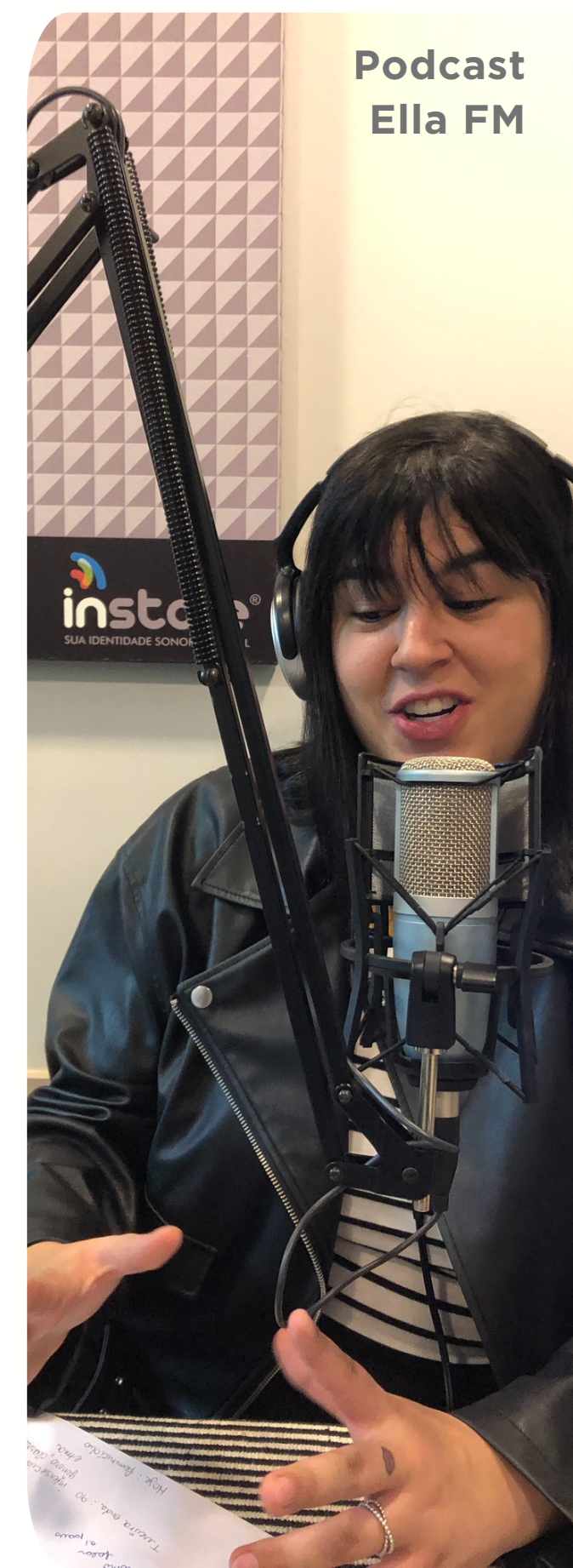
Podcast Ella FM