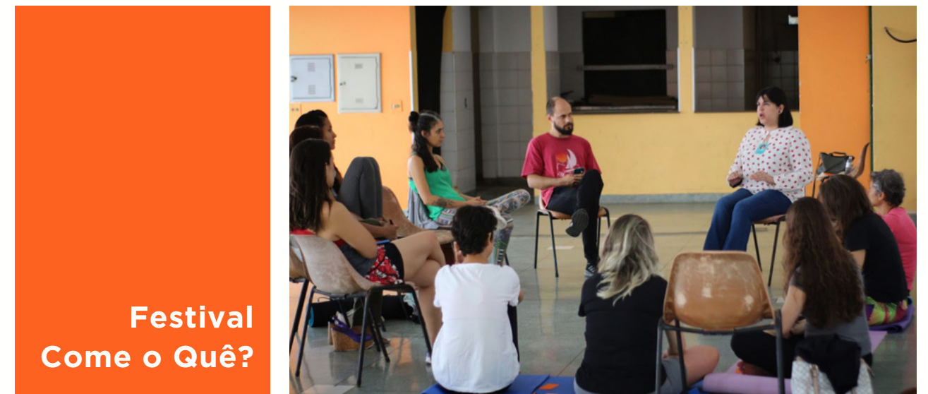
Festival Come o Quê?