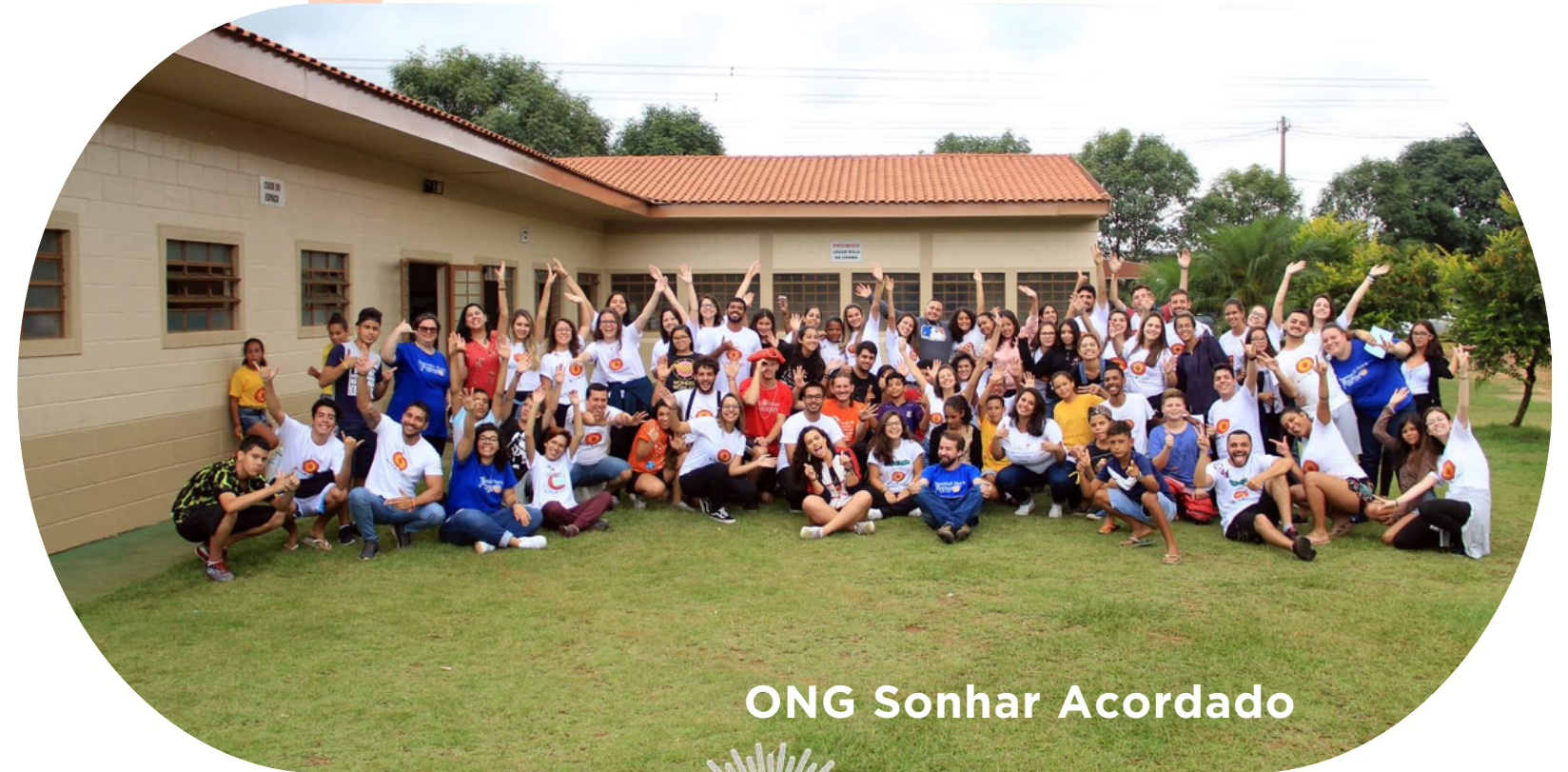
ONG Sonhar Acordado